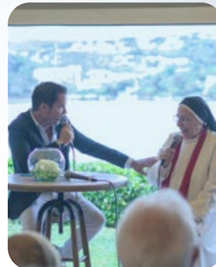
CORNER TALK 3: El talento para cambiar el mundo