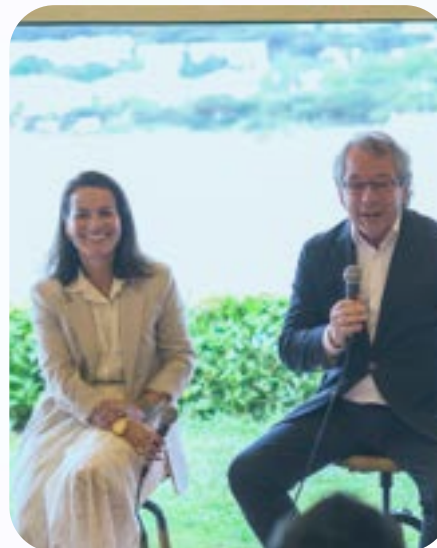
CORNER TALK 2: Liderar a través de la comunicación