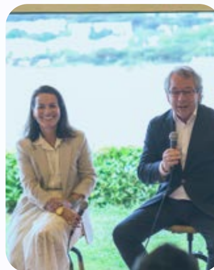
CORNER TALK 2: Liderar a través de la comunicación