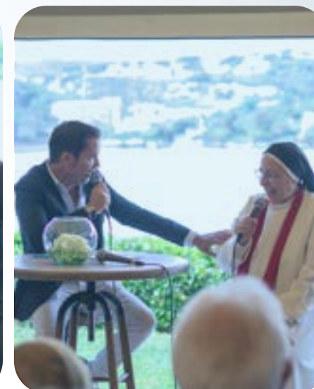
CORNER TALK 3: El talento para cambiar el mundo