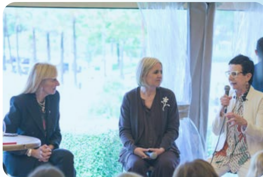
CORNER TALK 1: Liderazgo en femenino

Si no puedes asistir, puedes hacer una aportación económica directa a través de la web: www.labravissima.com